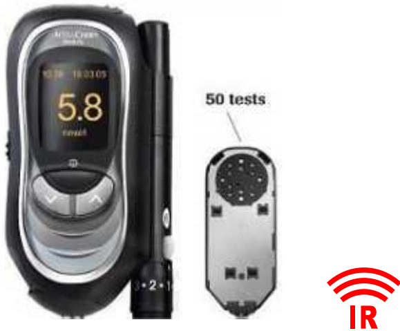
ACCU-CHEK Aviva (via Smart Pix)