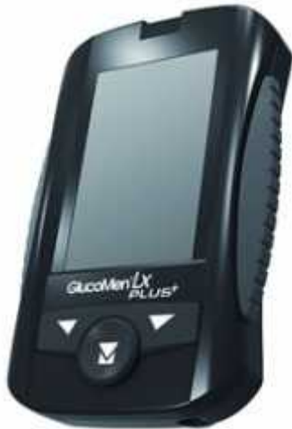
Glucomen LX Plus